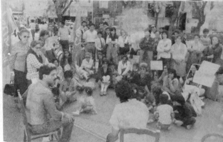
Teatro en la Plaza Colón.

es a trabajar y no se preocupa por el trabajo que tiene la mujer dentro de la casa. El está para traer el sueldo y la mujer tiene que hacer un milagro con ese sueldo que trae él para comprar la comida, la ropa, la mutualista (cuando se puede), la escuela, la túnica. Todo eso ellos no lo notan. Le dan a la mujer el hacer todo eso.